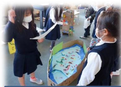
②2年 生活科 「おもちゃまつり」