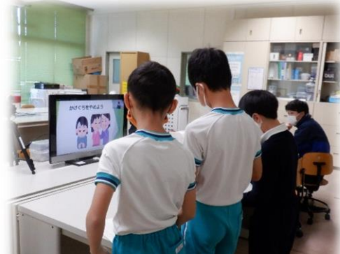
③人権月間に児童一人ひとりが取り組んだ「もちあじはたからもの」プリントと人権委員会が中心となった人権集会