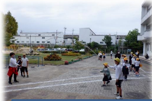
②全校たてわり活動 みな小タイム