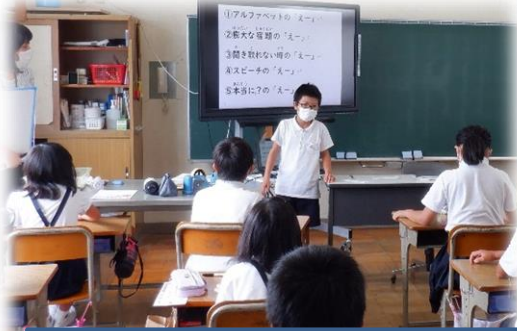
①4年 学期始めにみんなで コミュニケーションゲーム!