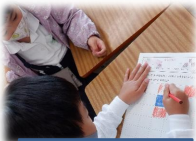
①1年 算数科 「ひろさくらべ」