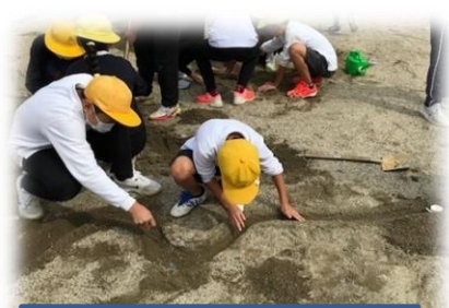
③5年 理科 「流れる水のはたらき」