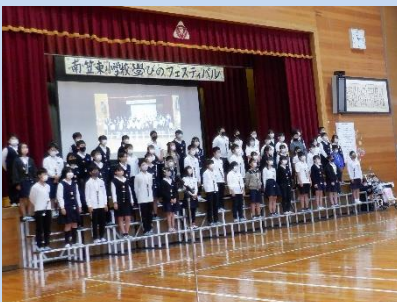
6年生：震災から学んだ事 ～災害から身を守ろう～