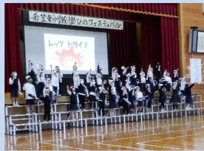
1年生：とどけたいな♪ 「音・声・リズム・楽しい気持ち」