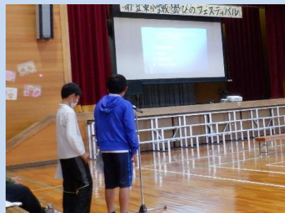
6年生実行委員会による 司会進行・幕間のクイズ