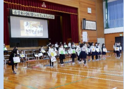
2年生：2回目のお手紙 ～かえるくんからがまくん～