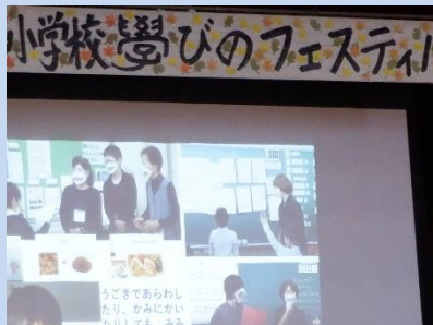
みどり学級：みどり学級の歌 「友だち」手話バージョン

11月12日(土)、感染対策を講じながら、学びのフェスティバルを開催しました。国語科や音楽科、生活科、総合的な学習の時間に学んだ事を、みどり学級・1年生から6年生の子どもたちが工夫して発表し、充実した時間になったと感じています。保護者のみなさまから温かい拍手をもらったことで、子どもたちもさらに自信を深めたことと思います。ご多用の中、ご参観いただき本当にありがとうございました。これからも「学びを楽しむ子」の育成をめざして、職員一同、Try!を続けます。