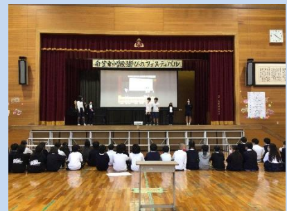
5年生：南笠東小学区 きれいプロジェクト