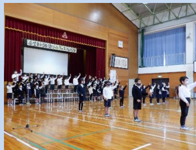
3年生：みんなにとってやさしい いらし～ほくたちにできること～