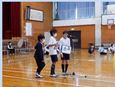
4年生：Short Stories ごとと博士に会いに行こう