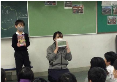
1年生 学年ビブリオバトル